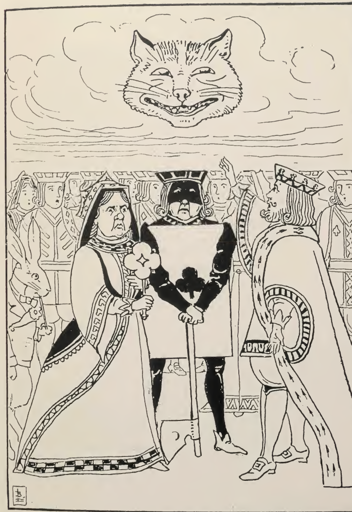
LA GEREĜOJ ARGUMENTAS KUN LA EKZEKUTISTO PRI EKZEKUTO DE LA SENKORPA KATKAPO.

Sed ĉar ĉiuj parolis samtempe, estis por ŝi tre malfacile bone aŭdi la diratajn vortojn.